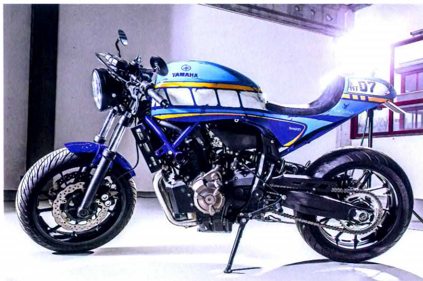
Mit dem Umbaukit von Benders lässt sich die MT-07 ratzfatz in einen schnittigen Cafe Racer verwandeln

YAMAHA Im Sommer 2015 fiel der europaweite Startschuss zum ersten Yard-Built-Wettbewerb für alle vom Umbauvirus befallenen Yamaha-Händler. Am Ende waren 41 Kreationen auf Basis des Sport-Heritage-Segments entstanden. Über 10000 Teilnehmer aus ganz Europa beteiligten sich an der anschließenden Abstimmung und wählten Dominik Klein aus Dillingen zum Sieger in der XJR-Kategorie. Das Bike rollt auf PVM-Rädern, die vorn in einer MT-01-Gabel stecken. Für die Hinterradführung sind Öhlins-Federbeine und eine modifizierte Racing-Schwinge verantwortlich. Die Auspuffanlage mit Akrapovic-Töpfen bekam eine weiße Keramikbeschichtung. Die Lackierung: Brandy-Red, ein Farbton der RD 350 aus dem Jahr 1973. yamaha-motor.eu